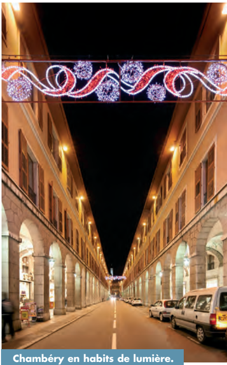
Chambéry en habits de lumière.