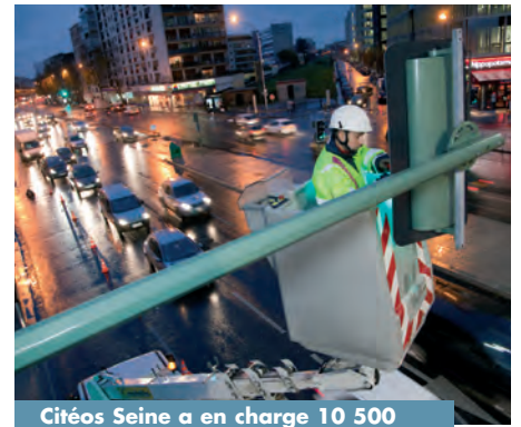
Citéos Seine a en charge 10 500 points lumineux et 121 carrefours.

Citéos Seine a remporté pour quatre ans le contrat d'entretien de l'éclairage public et de la signalisation tricolore des villes de la Communauté d'agglomération du Val de Bièvre (94) : Villejuif, Le Kremlin-Bicêtre, Arcueil, Cachan et Gentilly. Pas moins de 10 500 points lumineux et 121 carrefours ! Les équipes de Bagneux ont convaincu la collectivité grâce à un mémoire technique étayé et un prix compétitif. Avec deux à quatre équipes dédiées, les moyens humains et matériels mis en œuvre pour assurer une haute qualité de service ont