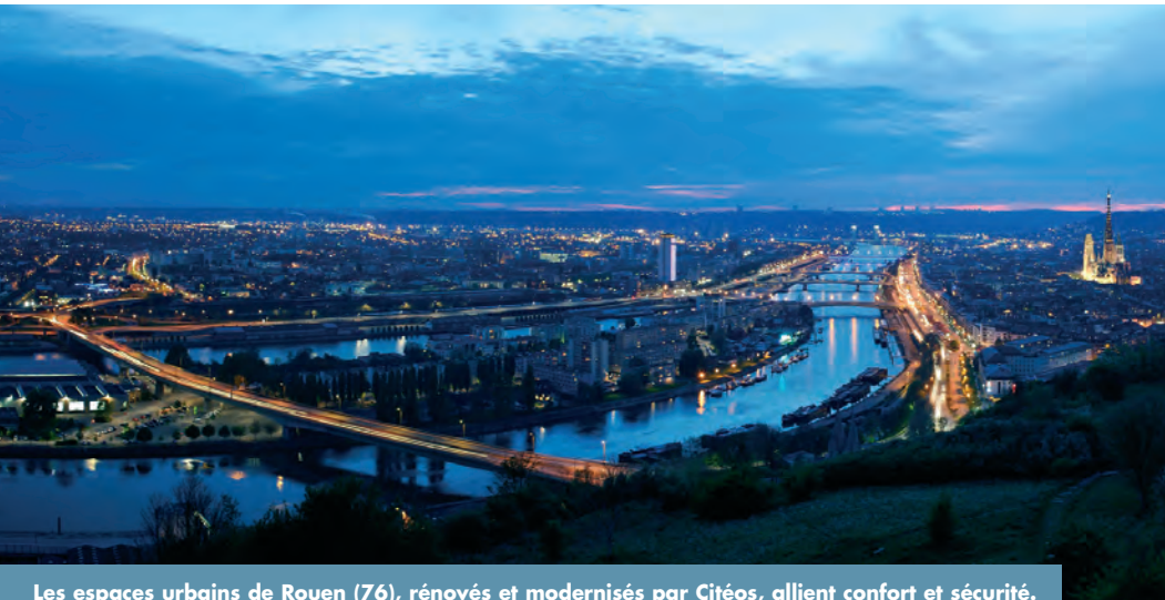
Les espaces urbains de Rouen (76), rénovés et modernisés par Citéos, allient confort et sécurité.

A ttractives, confortables et séduisantes : les villes sont envisagées différemment du fait des enjeux environnementaux et sociaux, et des évolutions techniques. Maîtrise énergétique, sécurité et embellissement... les collectivités de toutes tailles pensent désormais leurs projets de manière globale, y intégrant lumière, services et équipements urbains.