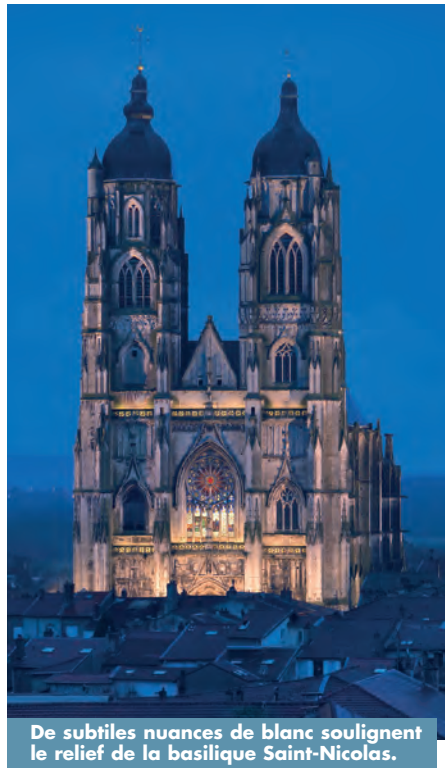
De subtiles nuances de blanc soulignent le relief de la basilique Saint-Nicolas.

La basilique Saint-Nicolas, emblème de Saint-Nicolas-de-Port (54), est l'un des plus prestigieux édifices de Lorraine. Sa mise en lumière, sobre, sans ostentation, souligne la somptueuse architecture gothique du monument. Le concepteur Guillaume Jéol a joué sur les reliefs et les reflets par de subtiles nuances de blanc.